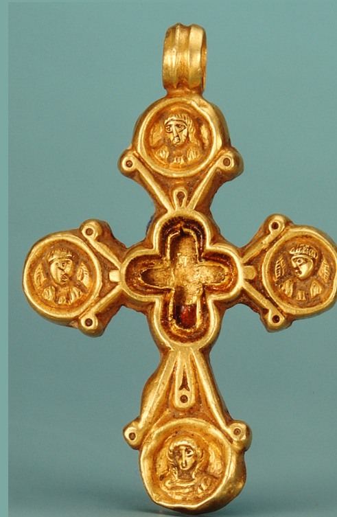
croix pectorale, fin Vie-VIle siècle, or et grenat, MAH inv. AD 7489

1 e Rencontre scientifique de l'Association suisse des études byzantines